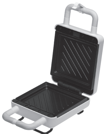
Płytki do kanapek Płytki do smażenia jajek