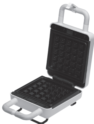
Płytki do gofrów